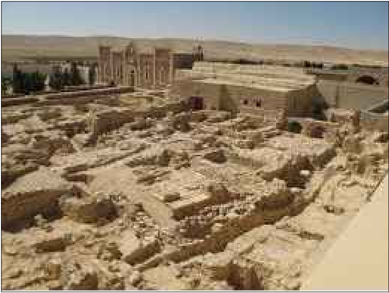
Vista complessiva del Monastero