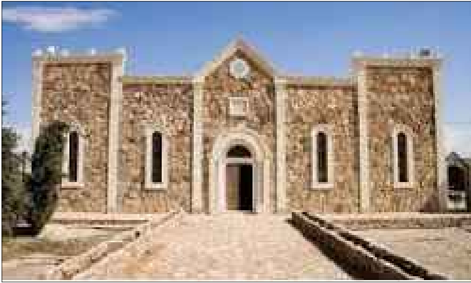
Facciata della Chiesa